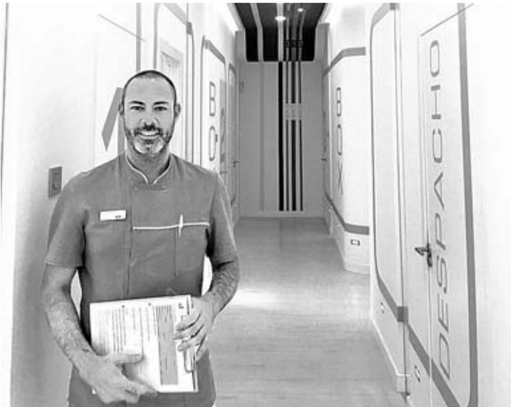
Gabinete de una prestigiosa clínica dental asturiana. A la derecha, el director del área clínica de un centro dental, en sus instalaciones.